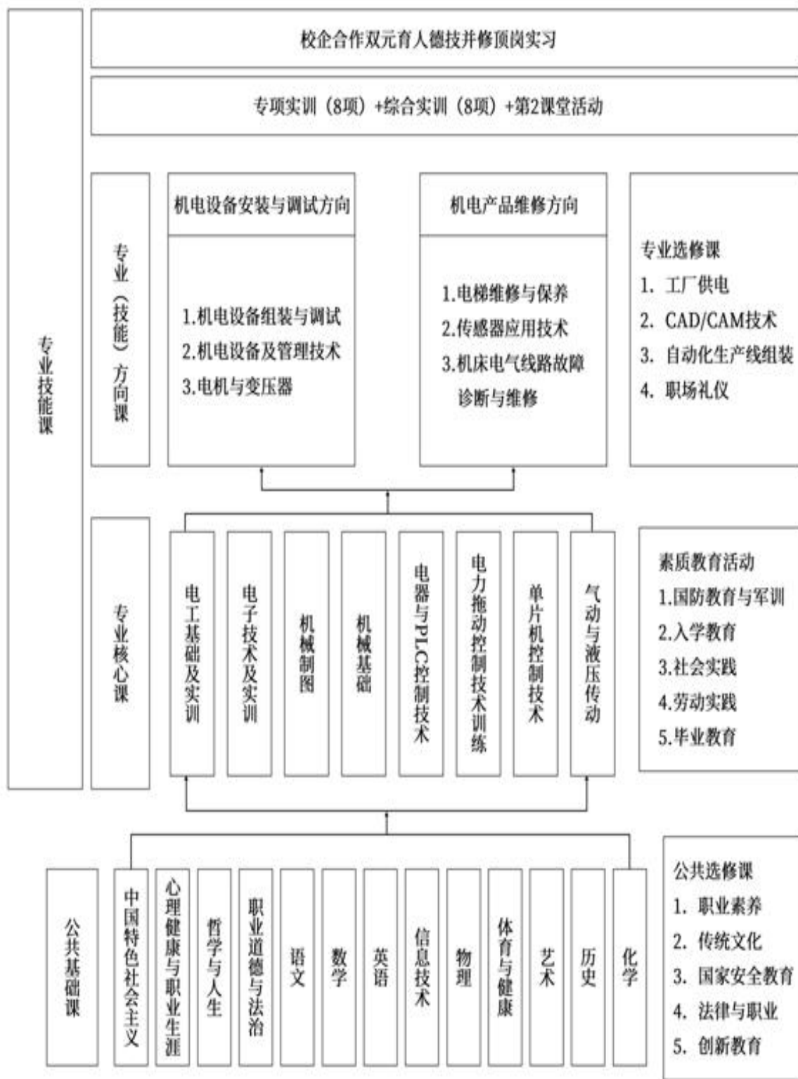
图 1 机电技术应用专业课程结构框架图